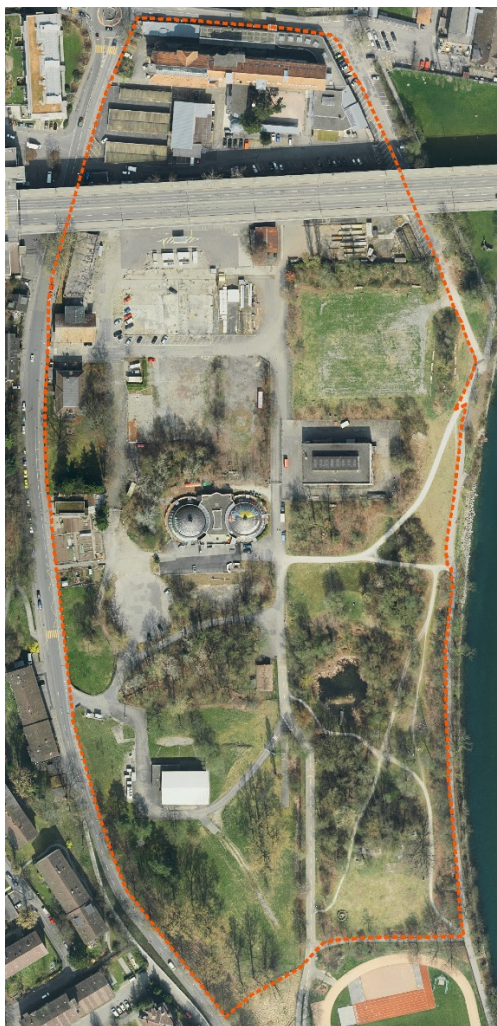
Abb.1 Bearbeitungsperimeter für Erhebungen zu Naturwerten (Fläche 918a)

Als Basis für die Erhebung der Naturwerte dient der vom Auftraggeber vorgegebene Planungsperimeter. Anlässlich der Startsitung mit der Kontur Management AG (11.9.15) wurde der Bearbeitungsperimeter für die Naturwerterhebung nochmals im Detail geklärt. Die Erhebungen der Naturwerte erfolgen demnach sinngemäss nur für die Flächen im Gaswerkareal östlich der Sandrainstrasse (ohne Brückenkopf). Anlässlich einer am 22.10.15 erfolgten Absprache mit Stadtgrün (Sabine Tschäppeler) und dem Tiefbauamt (Dina Brügger) wurde der Bearbeitungsperimeter auf der Ostseite wegen der Überschneidungen mit dem Hochwasserschutzprojekt nochmals etwas verkleinert und an die bestehende Wegführung entlang der Aare angepasst. Sämtlichen Auswertungen zu den Naturwerten basieren auf diesem definierten Bearbeitungsperimeter.