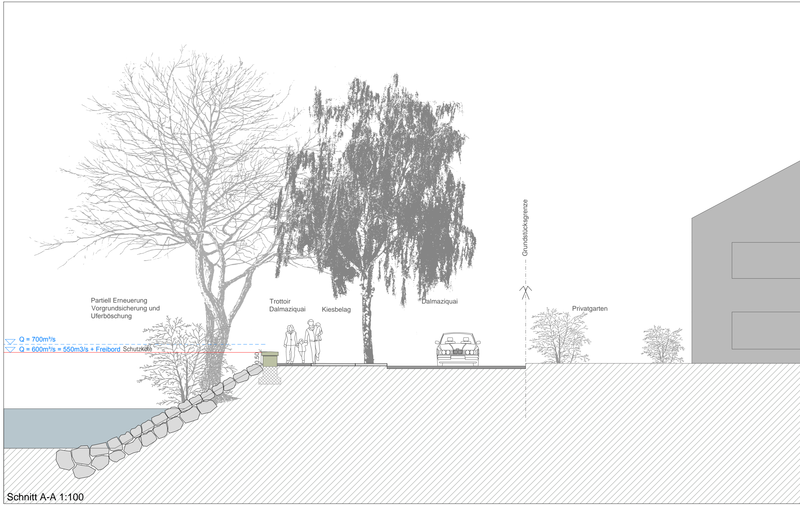
Schnitt A-A 1:100