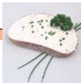
Frischkäse auf Brot