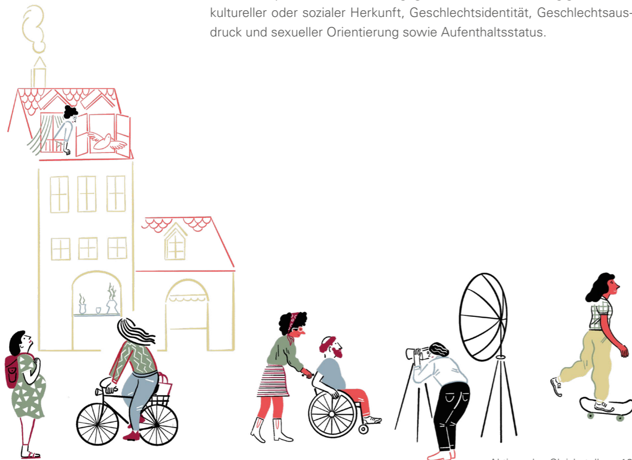
Aktionsplan Gleichstellung 16

Ziele Die Stadt Bern setzt die Istanbul-Konvention – das 2018 in Kraft getretene Übereinkommen des Europarats zur Verhütung und Bekämpfung von Gewalt gegen Frauen und häuslicher Gewalt – in ihrem Einflussbereich konsequent um. Sie schützt Frauen und Mädchen sowie queere Menschen vor physischer, psychischer und sexueller Gewalt. Sie verhütet und bekämpft häusliche Gewalt gegen Menschen unabhängig von Alter, kultureller oder sozialer Herkunft, Geschlechtsidentität, Geschlechtsausdruck und sexueller Orientierung sowie Aufenthaltsstatus.