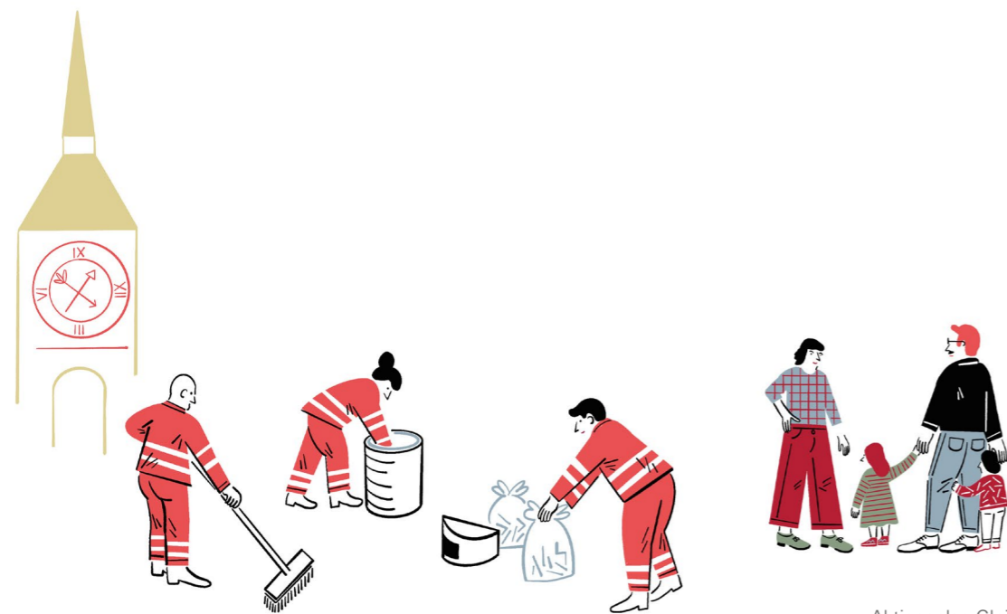
Aktionsplan Gleichstellung 20

Ziele Als Arbeitgeberin schafft die Stadt Bern ein für alle Geschlechter inklusives Arbeitsumfeld. Sie fördert das berufliche Fortkommen und die Vereinbarkeit mit Care-Aufgaben für Kinder und betreuungs- oder pflegebedürftige nahestehende Personen.