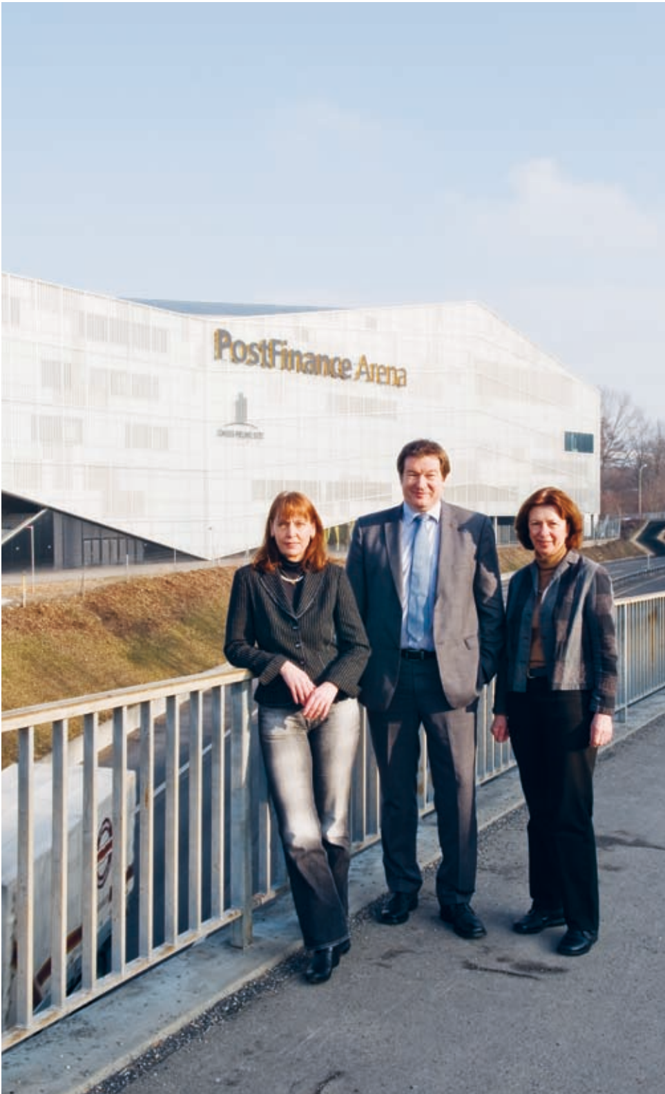
Das Team des Abteilungsleiters mit seinem Abteilungsstab und Assistenz vor der Berner Eishockeyarena. Im Mandatverhältnis für die Bern Arena Stadion AG erfüllt die Liegenschaftsverwaltung die Aufgaben des Facility Managements der PostFinance-Arena.