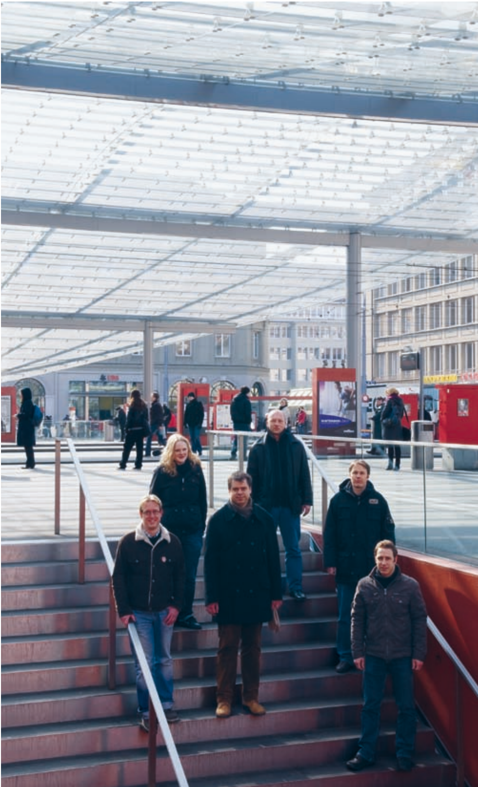
Das Team Finanzen und Administration (F+A) unter dem Baldachin am Bahnhof – auf der Treppe zur Christoffelunterführung. Die wirtschaftliche Bilanz des neu gestalteten Durchgangs zum Bahnhof lässt sich nach einem Jahr Vollvermietung sehen. Sowohl die Erwartungen des Fonds als Vermieter wie auch diejenigen der Mieterschaft wurden erfüllt, teilweise sogar übertroffen.