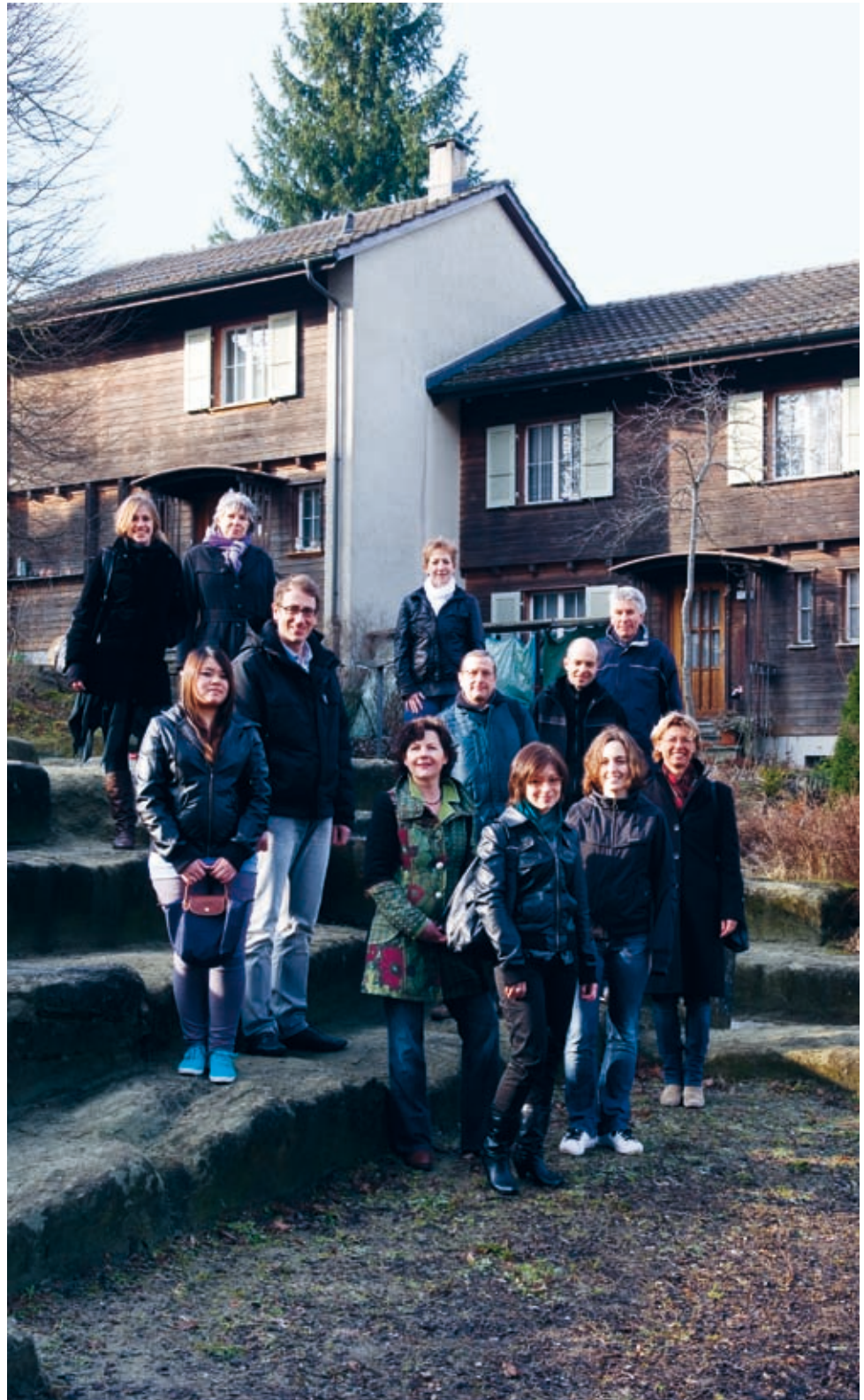
Das Team der Immobilienverwaltung (IVW) vor den Reiheneinfamilienhäusern der in den 1940er-Jahren entstandenen Siedlung Hohliebi im Westen der Stadt. Im Rahmen eines Impulsprogramms wurden in der Siedlung Investitionen, die gemäss Planung für das Jahr 2010 vorgesehen waren, ein Jahr früher getätigt.