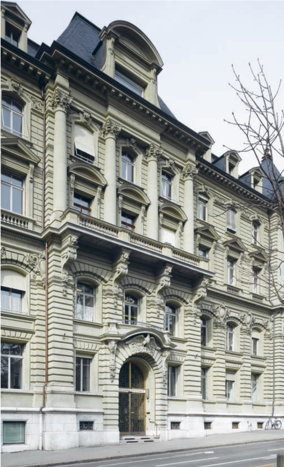
Zentrale Lage: Im Bürohaus an der Schwannengasse 14, dem Sitz der Direktion für Finanzen, Personal und Informatik, befindet sich die Liegenschaftsverwaltung. Hier trifft sich auch die Betriebskommission des Fonds zu ihren Sitzungen.