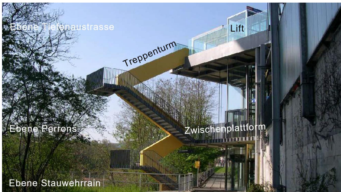
Abbildung 2: Ansicht Station Felsenau (Blickrichtung Stadtzentrum)

Die Konstruktion aus Stahlbetonelementen sowie Glas und Metall, die nun seit bald 20 Jahren in Betrieb ist, befindet sich im Eigentum der Stadt Bern und des RBS. Die Zuständigkeiten für den baulichen und betrieblichen Unterhalt sind vertraglich geregelt. Zusätzlich steht der Treppenturm auf dem Boden des Bundesamts für Strassen (ASTRA). Hierzu besteht noch keine Vereinbarung – mit Abschluss des Sanierungsprojekts soll ein Dienstbarkeitsvertrag zwischen den Eigentümer*innen und dem ASTRA abgeschlossen werden.